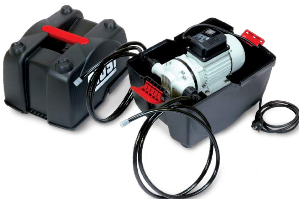
PIUSIBOX CAR SUCTION